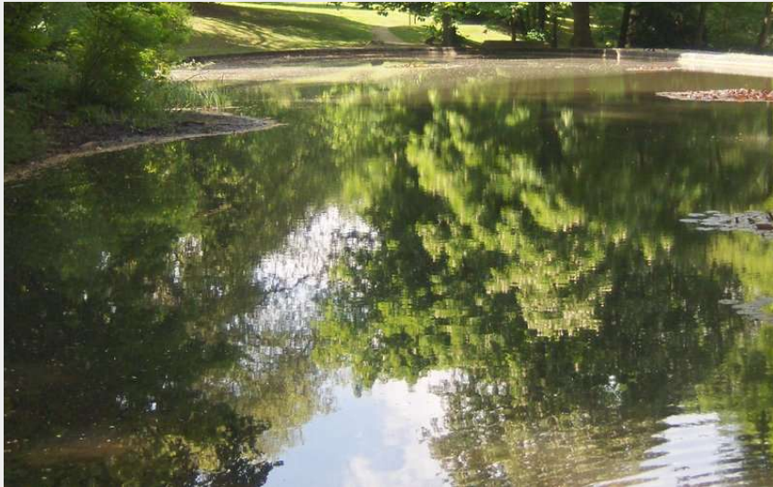
Parc de Toutedville (PNROPF)